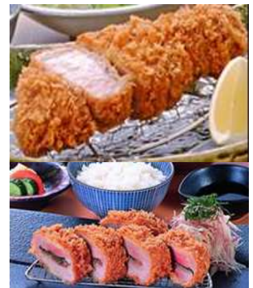
“ねぼけ”の絶品とんかつ