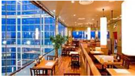
こだわりとんかつ ねぼけ 水戸京成店